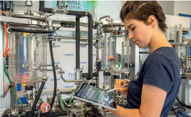
Die Lehrveranstaltungen finden während des Semesters 14-tägig am Freitag/Samstag statt zusätzlich einer Blockwoche. Es erfolgt eine Profilbildung ab dem 6. Semester. Weitere individuelle Schwerpunkte können über Wahlpflichtfächer gesetzt werden.